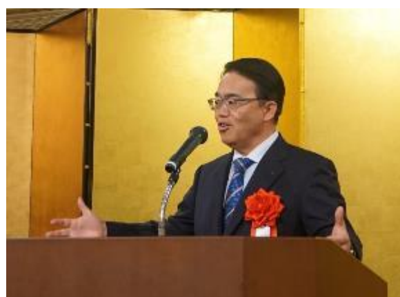
歓迎挨拶 大村秀章 愛知県知事