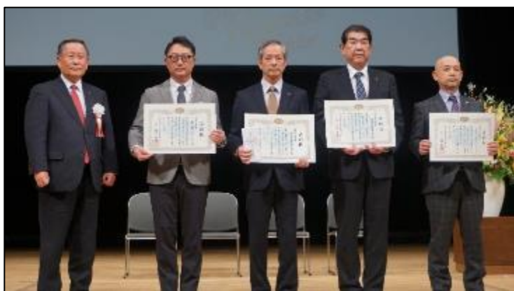
山形県送客キャンペーン受賞者の皆様