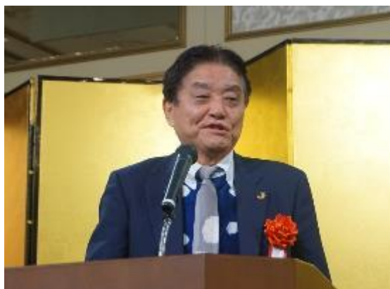
歓迎挨拶 河村たかし 名古屋市長