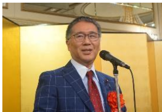
来賓挨拶 伊藤忠彦 衆議院議員