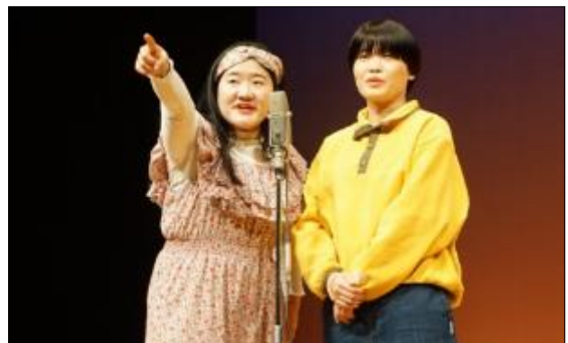
ガンバレルーヤ（左:よしこさん 右:まひるさん）

展示ブースの見学時間後、ステージでは人気お笑い芸人「ガンバレルーヤ」がコミカルなトークショーを繰り広げ、会場は大いに盛り上がった。地元出身のよしこさんから、愛知にまつわる心温まるエピソードなども披露され、大きな笑いに包まれた。