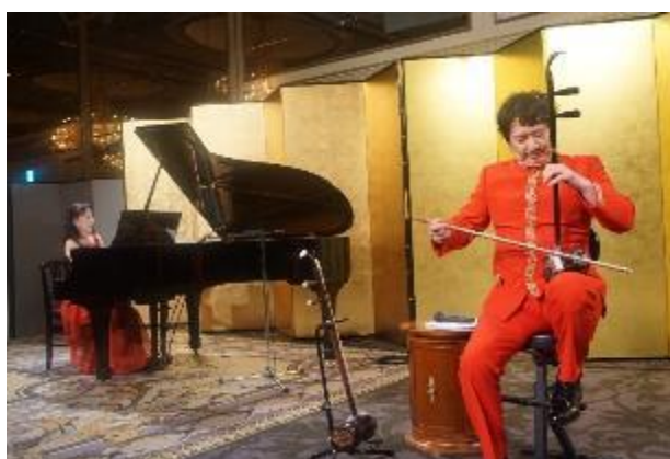
アトラクション 二胡演奏