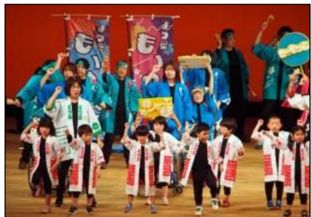
オープニングアトラクション よつ葉庄内ハッピーダンスクラブ