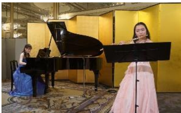
ウェルカムミュージック ピアノ・フルート演奏